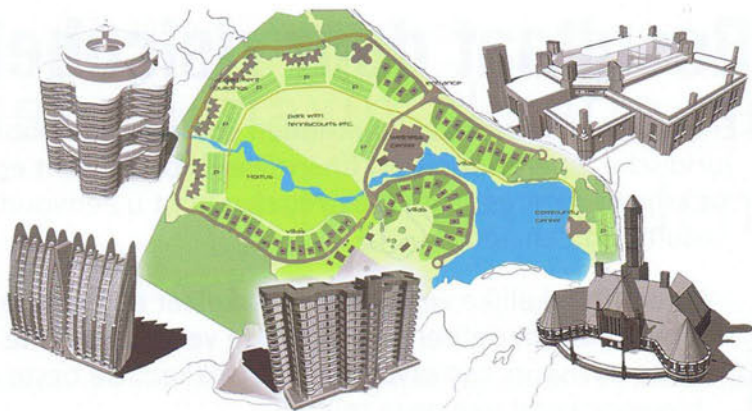
Retirement community Virginia (VS)

Naeld, bestaande uit 23 gezinswoningen met een hoge mate van variatie, zestien appartementen en vijfhonderd vierkante meter aan commerciële ruimte. Herkenbaarheid is een belangrijk uitgangspunt van het stedenbouwkundig ontwerp van het gebied. Historische kenmerken als hooibergen keren hier terug in het straatbeeld.