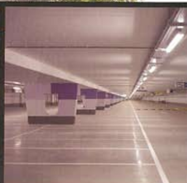
BRANDETECTIE IN PARK