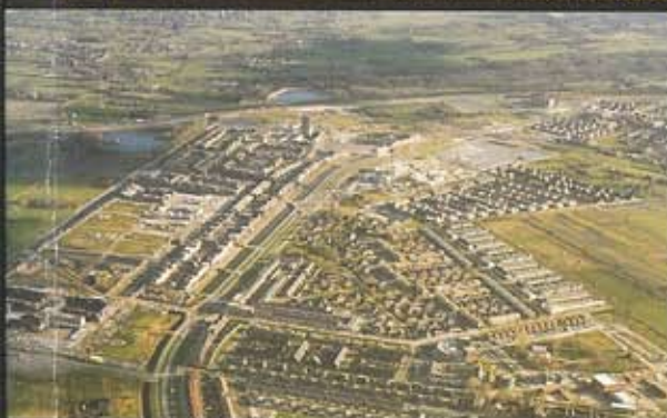
PKVW IN VATHORST