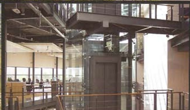
BRANDWEERLIFTEN EN BOUWBESLUIT